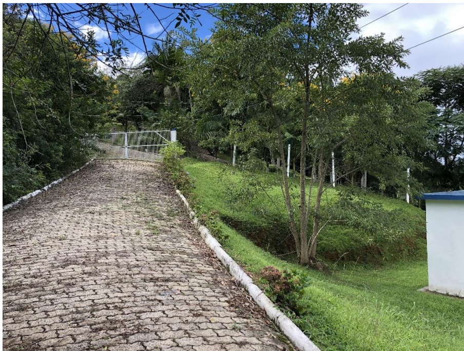
Figura 12: isolamento ETA e reservatórios