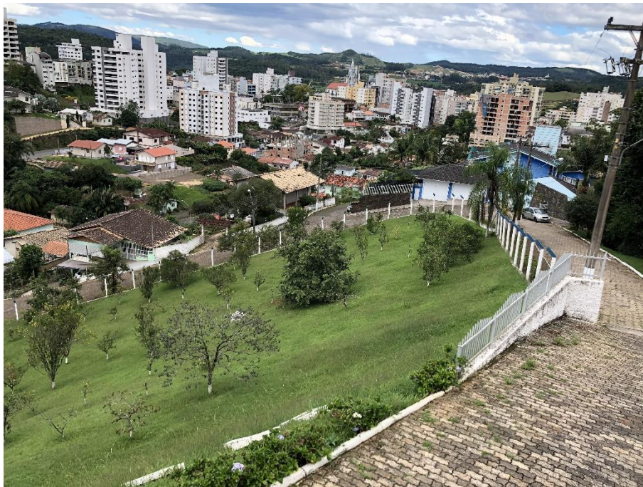
Figura 11: isolamento ETA e reservatórios

Recomendações: manutenção do isolamento.