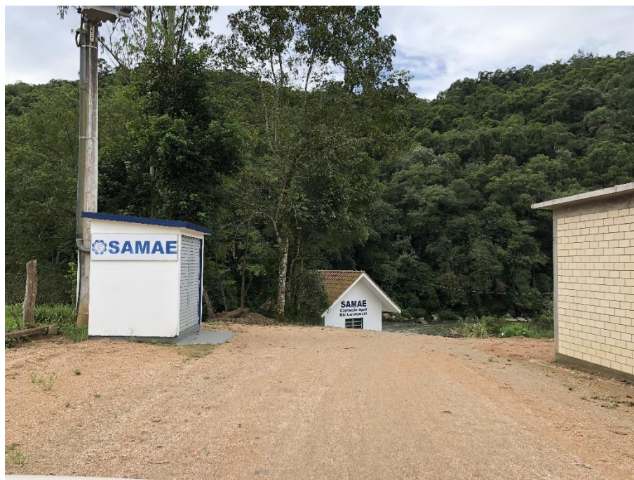
Figura 3: captação Rio Laranjeiras

Site: www.cisam-sul.sc.gov.br E-mail: cisam@cisam-sul.sc.gov.br Fone/fax: (048) 3466-4261