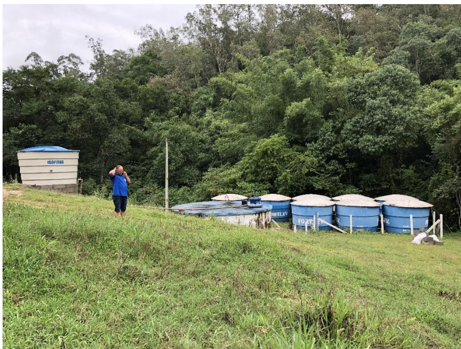
Figura 5: isolamento nascente Pindotiba

Site: www.cisam-sul.sc.gov.br E-mail: cisam@cisam-sul.sc.gov.br Fone/fax: (048) 3466-4261