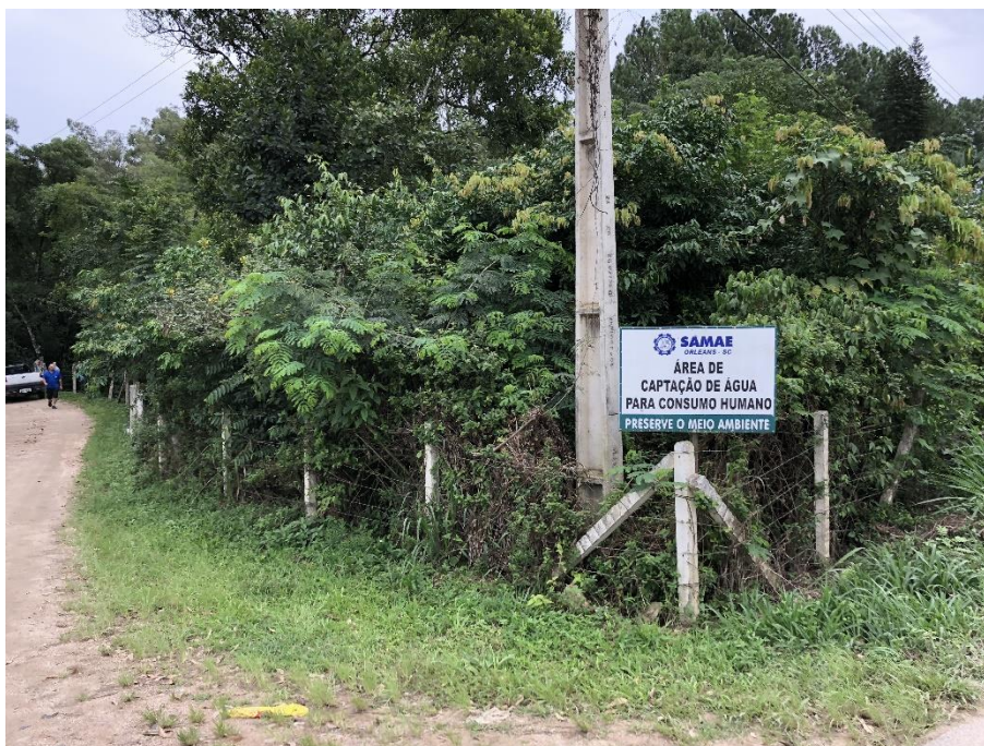
Figura 1: captação represa

Site: www.cisam-sul.sc.gov.br E-mail: cisam@cisam-sul.sc.gov.br Fone/fax: (048) 3466-4261