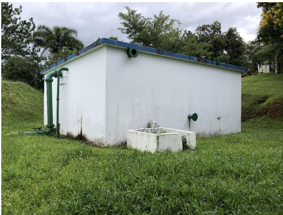
Figura 10: reservatório ETA