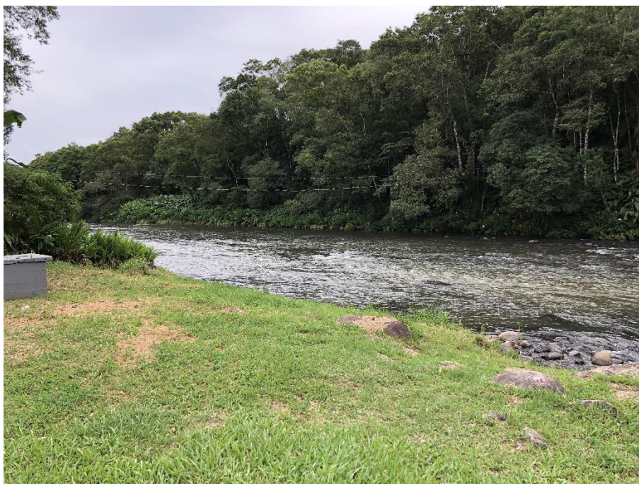
Figura 8: captação rio laranjeira

Site: www.cisam-sul.sc.gov.br E-mail: cisam@cisam-sul.sc.gov.br Fone/fax: (048) 3466-4261