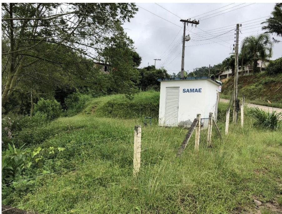
Figura 6: poço Brusque