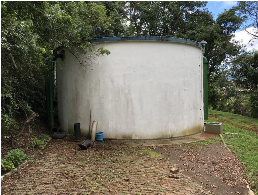
Figura 9: reservatório da ETA

Site: www.cisam-sul.sc.gov.br E-mail: cisam@cisam-sul.sc.gov.br Fone/fax: (048) 3466-4261