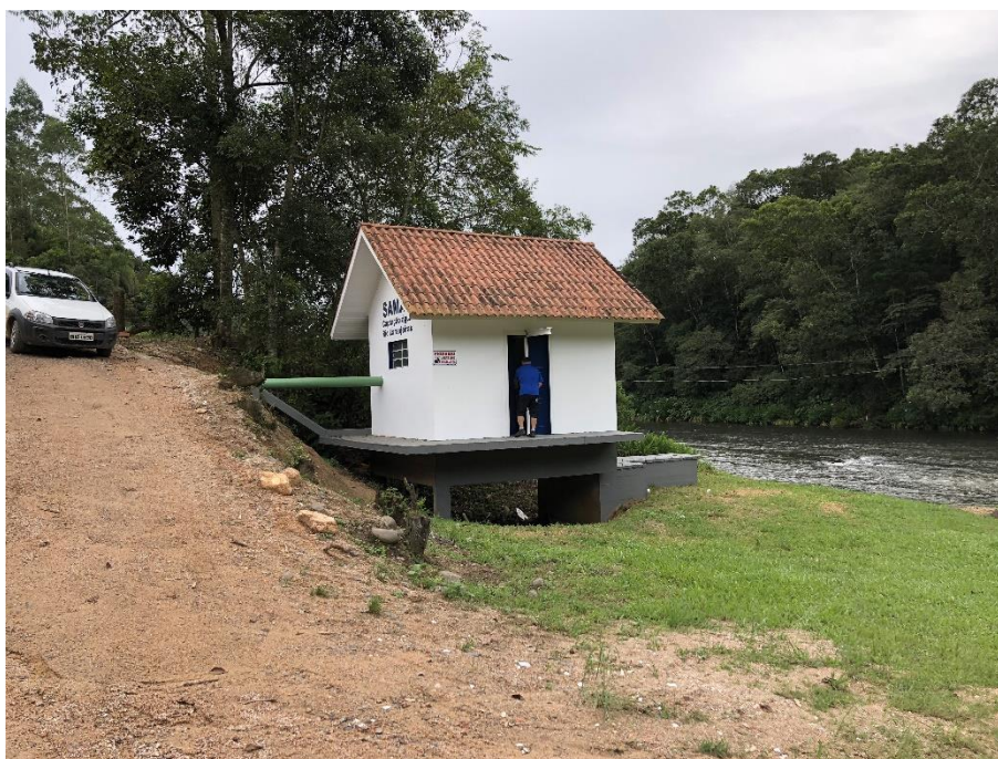
Figura 2: captação Rio Laranjeiras