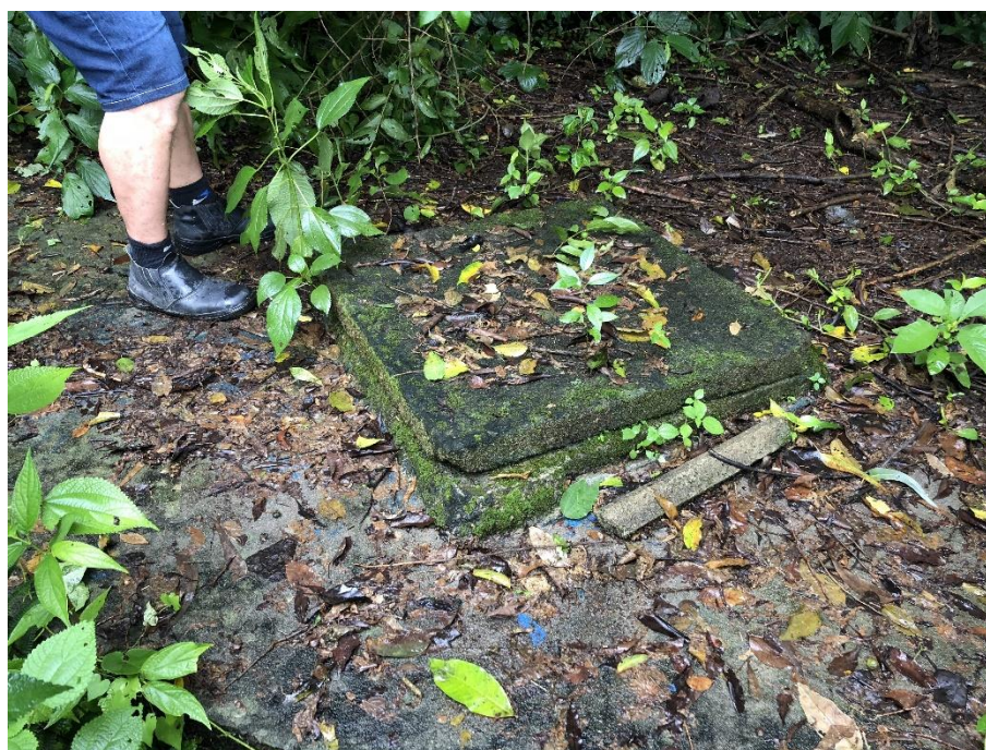
Figura 4: nascente Pindotiba